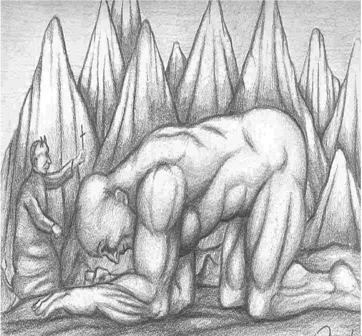
Ilustración 1 De rodillas Antonio Ruiz